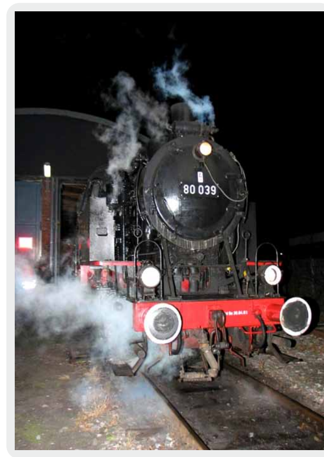
Die BR 80 039 bei Nacht

Sieben Maschinen blieben der Nachwelt erhalten: 80 009, 013, 014, 023, 030, 036 und 039. 80 039 kommt unter Regie der Hammer EF regelmäßig zum Einsatz.